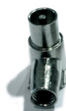
C 95 M C 95M 6