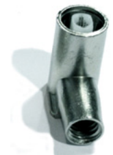
C 95 H C 95H 6