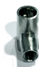
CF 90 CF 90-6