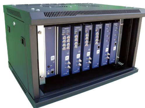
MONTAJE CON CHR TR