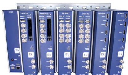
MONTAJE CON CHM TR